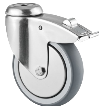
La foto puede diferir del producto original